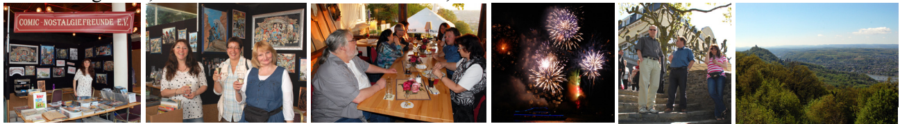
Am 4.-5. Mai gab's: Börse satt, fröhliche Mädels, ein besinnlicher Tagesausklang über dem Rhein, Feuerwerk und Katerfrühstück in der grünen Hölle.